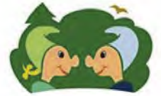
Holzlandwichtel Naturkindergarten Schröding

Interessierte Familien, die den Naturkindergarten „Holzlandwichtel Schröding“ kennenlernen möchte, sind herzlich eingeladen, am Freitag, den 10. Februar 2023 von 15 Uhr bis 17 Uhr das Holzlandwichtel-Gelände (Lindenweg 8) zu besuchen. Gerne beantwortet das pädagogische Team alle Fragen rund um den Naturkindergarten (Konzeption, Tagesablauf, Öffnungs- und Buchungszeiten, etc.). Eine Anmeldung für den Info-Nachmittag ist nicht erforderlich.