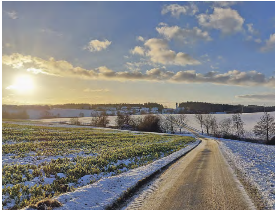
Winter zwischen Irlach und Schröding