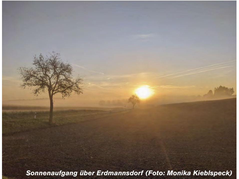
Sonnenaufgang über Erdmannsdorf

Spruch des Monats: Tausende von Kerzen, kann man am Licht einer Kerze anzünden, ohne dass ihr Licht schwächer wird. Freude nimmt nicht ab, wenn sie geteilt wird.