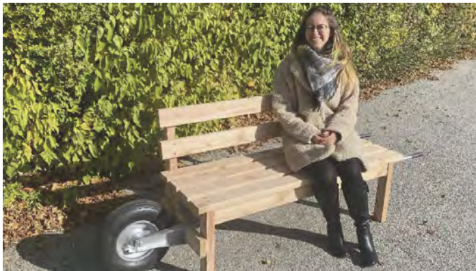
Mobiles Ratschbankerl vor dem Quartiersmanagement-Büro

Um die Bank mobil zu machen, haben wir sie in Anlehnung an eine Schubkarre gebaut. Diese besondere Konstruktion erlaubt es, das Ratschbankerl