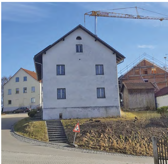
alter Pfarrhof Hohenpolding

Ich freue mich schon auf ein Wiedersehen. Ihr/Euer Fonse Beilhack