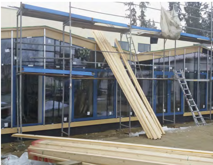
Momentaufnahme des Bauzustands der Mittagsbetreuung (11.12.2020)

Je nach Witterung soll im Laufe des Dezembers von der Zimmerei Schlehuber aus Mauggen in Zusammenarbeit mit der Fa. Miller aus Moosburg (Spengler- und Abdichtungsarbeiten) der Dachstuhl der neuen Mittagsbetreuung fertig gestellt werden. Der Einbau der Pfosten-Riegel-Fassade auf der Nordseite des Gebäudes in Richtung Pausenhof durch die Firma Brummer Metallbau aus Tiefenbach bei Passau ist bereits größtenteils abgeschlossen. Die Vergaben der Gewerke Heizung-Sanitär und Lüftung sind für die Dezember-Sitzung des Gemeinderates vorgesehen. Die Ausschreibungen für die Gewerke Estricharbeiten und Trockenbau laufen bereits und die Ausschreibungen für die Elektroarbeiten und die Fliesenlegerarbeiten befinden sich aktuell in Vorbereitung.