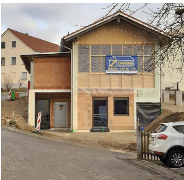
neues Gemeinschaftshaus (Rohbau)