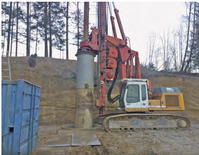
Überbohren des Brunnens mittels Pfahlbohrgerät

Der Brunnen I Inning liegt am nordwestlichen Ortsrand von Inning, wurde 1961 mittel Kunstharz-Pressholz Voll- und Filterrohren bis zu